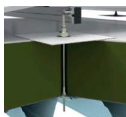
Warm dak TRAPEZIUM