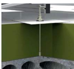
Warm dak BETON

We leveren gereedschappen voor ieder type dak en door het gebruik van deze tools is de installatie eenvoudig, effectief en veilig.