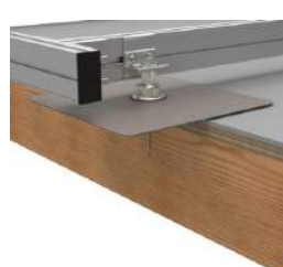
Koud dak HOUT