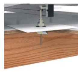
Koud dak HOUTEN PLAAT